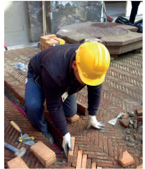
Ripristino pavimentazione in cotto Museo Archeologico Nazionale, Napoli