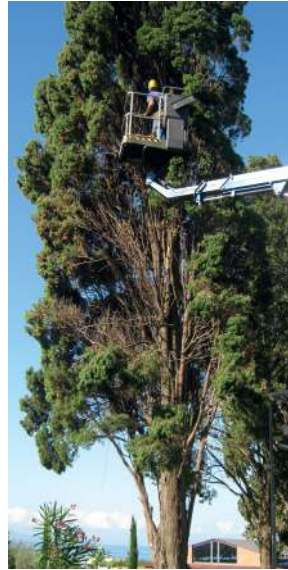
Potatura in quota su cipresso