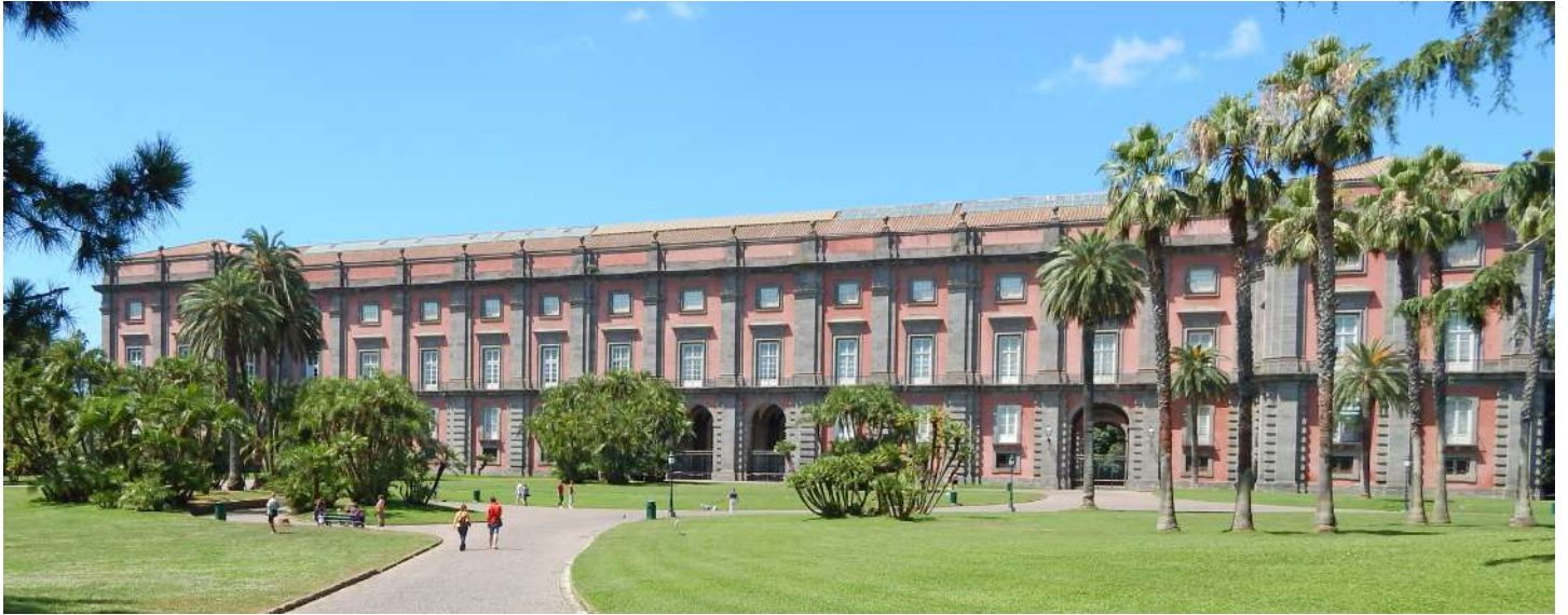
Museo e Real Bosco di Capodimonte, Napoli