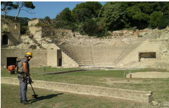
Parco Archeologico del Pausilypon, Napoli

Euphorbia collabora alla gestione di importanti progetti di riqualificazione, restauro e valorizzazione di aree a grande valenza archeologica e paesaggistica, migliorandone la fruibilità.