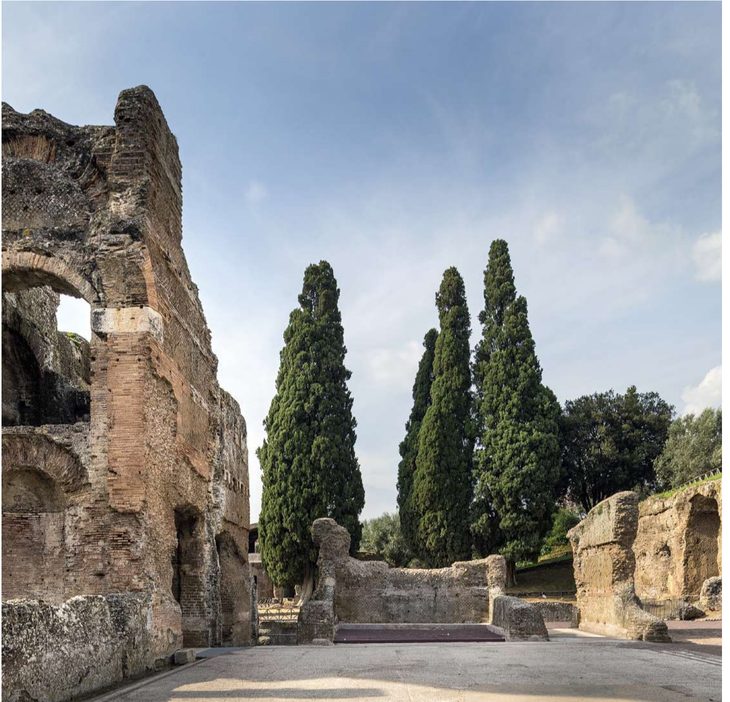
Villa Adriana, Tivoli (RM)