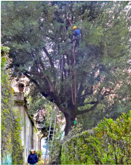
Tecnica di potatura in tree climbing Villa d'Este, Tivoli