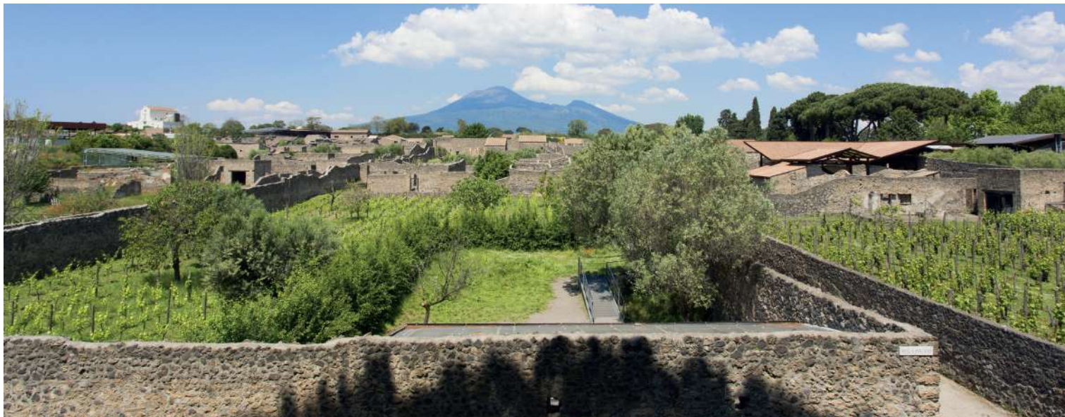
Parco Archeologico di Pompei, Napoli