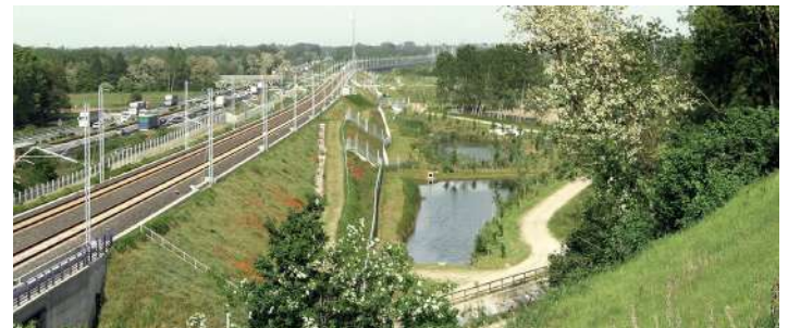
Realizzazione di opere a verde e opere di ingegneria naturalistica Linea Ferroviaria A.C. Milano-Genova "Terzo Valico dei Giovi".