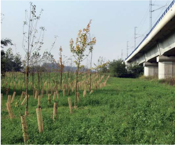
Realizzazione di opere a verde e di ingegneria naturalistica