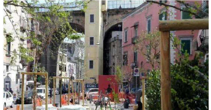
Verde urbano a Piazza Sanità, Napoli

Da sempre consapevole delle importanti funzioni svolte dal verde all'interno degli ambienti urbani, Euphorbia promuove da anni lo sviluppo e la creazione di oasi urbane, anche conosciute come urban forest . Parchi, giardini, autostrade, linee ferroviarie, aiuole, seguono i nuovi standard eco-sistemici vigenti, dove la componente ambientale, sempre più presente, si fonde con lo spazio cittadino. L'azienda ha acquisito negli anni una crescente professionalità nel settore dell'ingegneria naturalistica, realizzando opere di consolidamento naturalistico e riduzione dell'impatto ambientale. Sono all'attivo, infatti, imponenti opere di riqualificazione in funzione della salvaguardia dei delicati equilibri ambientali, come l'incremento della biodiversità, il controllo del microclima, la riconnessione delle reti ecologiche.