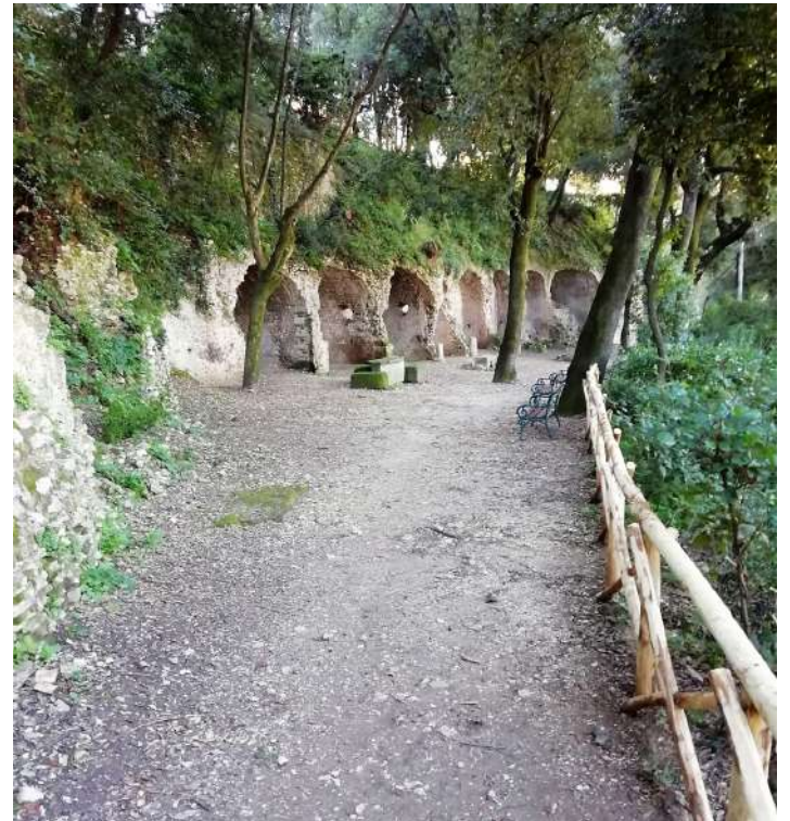
Parco di Villa Gregoriana, Tivoli (RM)