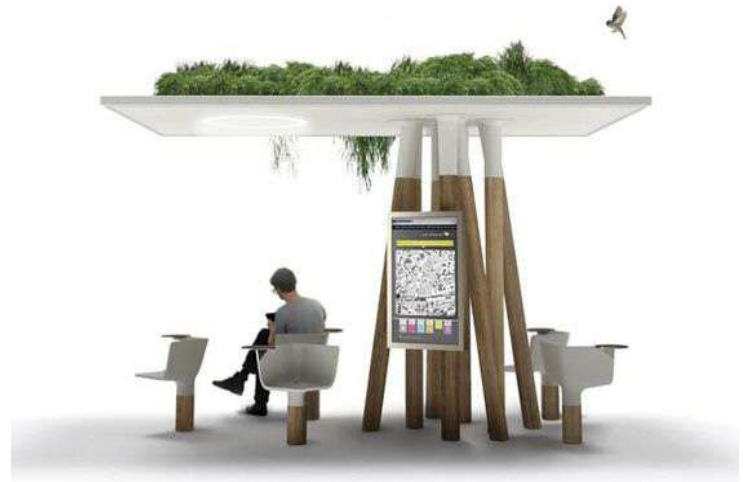
Esempio studio di pensilina con tetto verde

Studio e messa a punto di uno schedario di biomateriali e vegetazione bioassorbente, studio e realizzazione di una banca fitologica contenente una serie di organismi utili per il fitorimediale nella matrice aria, studio delle combinazioni vegetali per ottimizzare la cattura di elementi inquinanti, per il monitoraggio e la mitigazione dei rischi ambientali e il miglioramento del microclima urbano, è così che Euphorbia intende assumere da subito un ruolo di leader del mercato delle Green & Smart Urban Furniture a livello nazionale, con la concreta possibilità di accedere con successo anche al mercato UE.