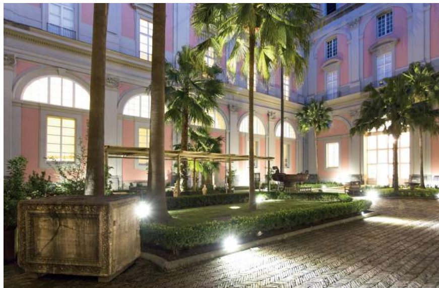
Museo Archeologico Nazionale di Napoli

Euphorbia Srl nasce nel 1995 da una solida tradizione familiare nel settore vivaistico, in cui affonda le proprie radici ereditando l'amore e la cultura per il paesaggio. La società si specializza nella cura e manutenzione dei giardini storici, del patrimonio verde in aree archeologiche, nella progettazione, gestione e realizzazione del verde pubblico e privato, nella cura del verde urbano e infrastrutturale.