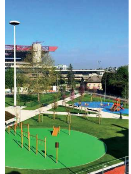
Realizzazione area giochi, metropolitana di Milano, stazione San Siro