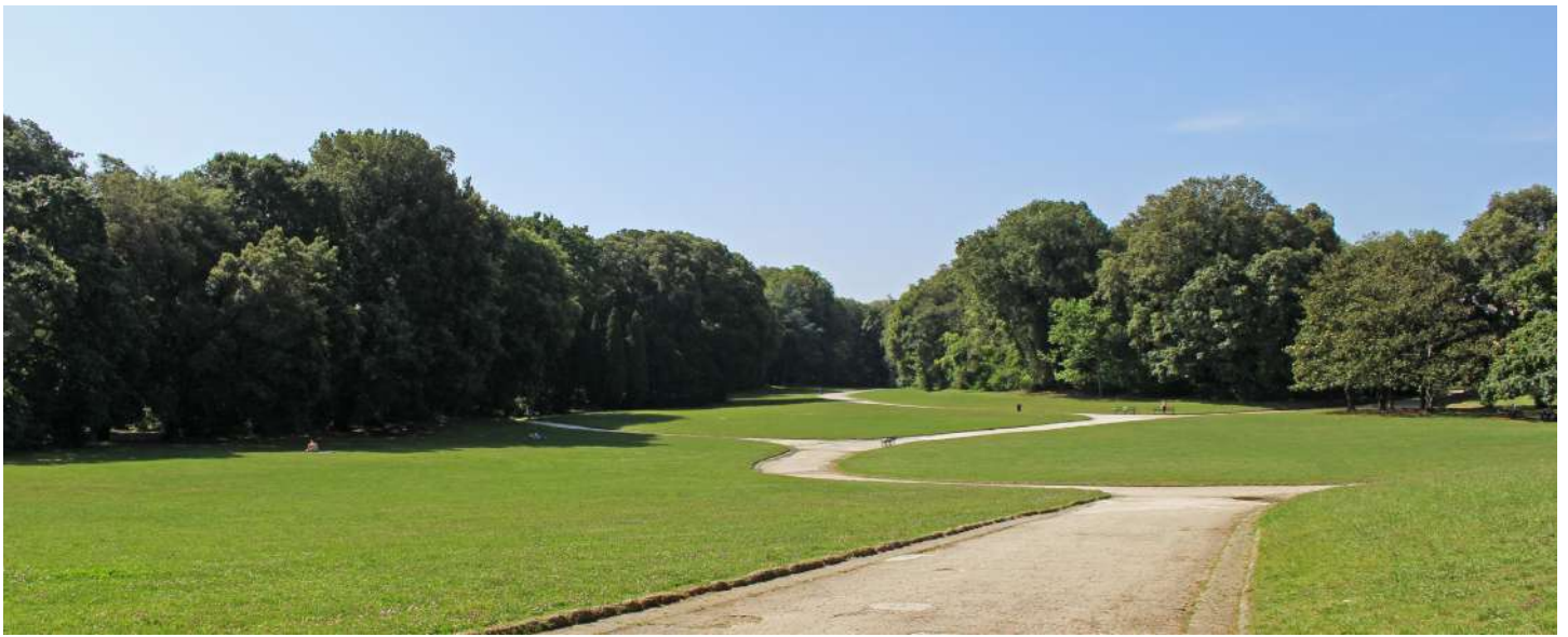
Museo e Real Bosco di Capodimonte, Napoli