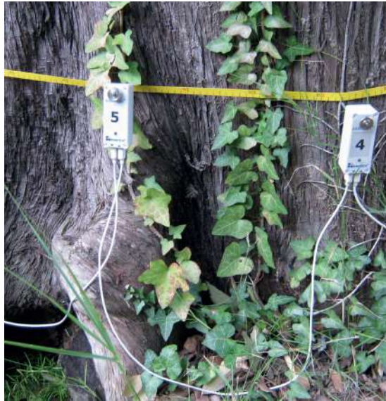
Analisi tomografica su cipresso ( Cupressus sempervirens )