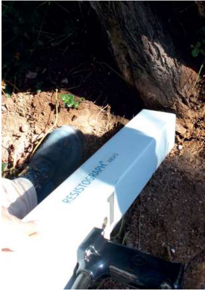
Prove penetrometriche su leccio ( Quercus ilex )