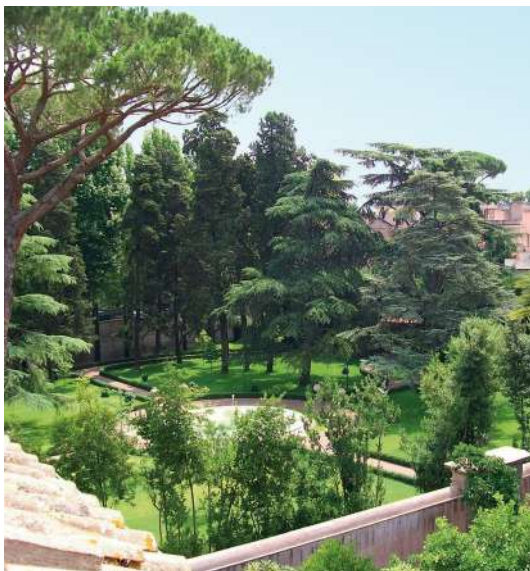
Villa Farnesina, Roma