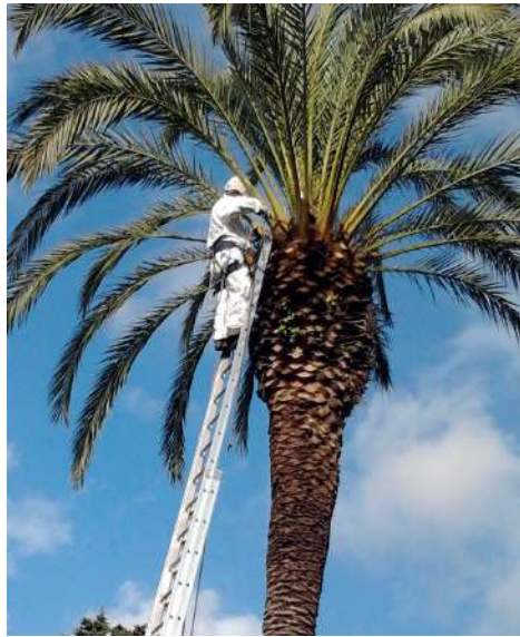
Trattamento contro il punteruolo rosso su un esemplare Phoenix dactylifera - Real Bosco di Capodimonte, Napoli